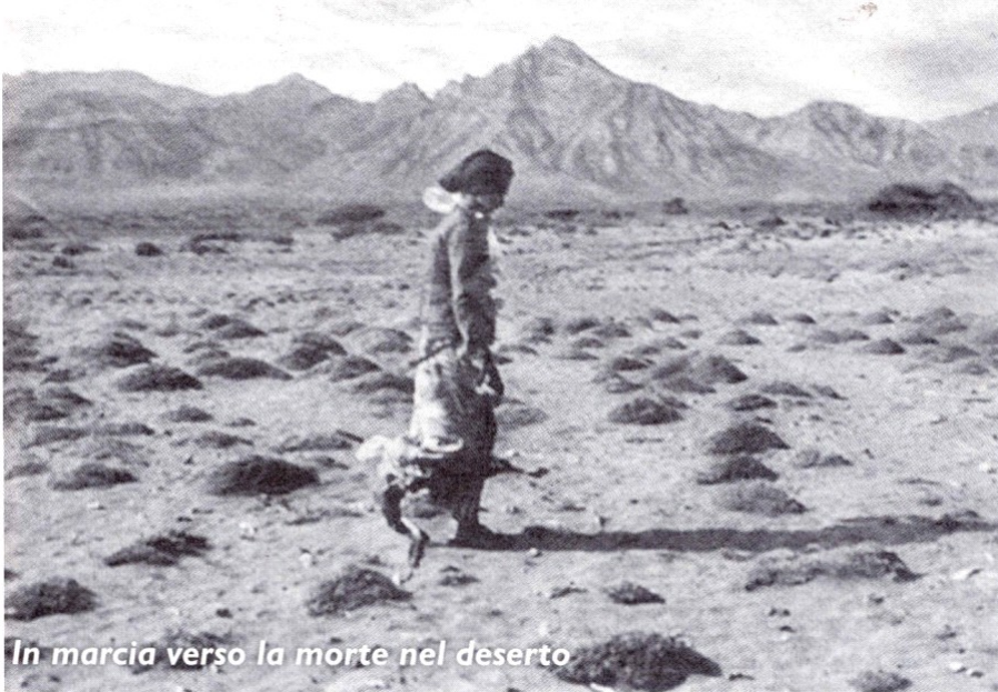
In marcia verso la morte nel deserto

contempo, visto che ci sono ancora persone che ci chiedono che cosa è l'Euro solidale, abbiamo provveduto a ristampare un volantino già a suo tempo distribuito con la speranza che questo possa far crescere una passione missionaria. Basta